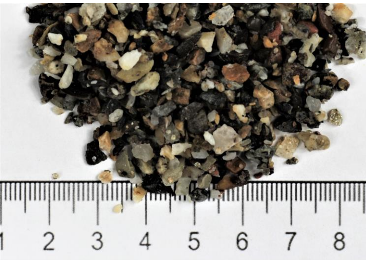
ghiaia di fiume 3/6