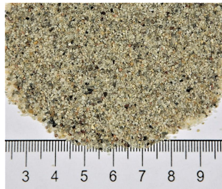
tipo bunker competition usga